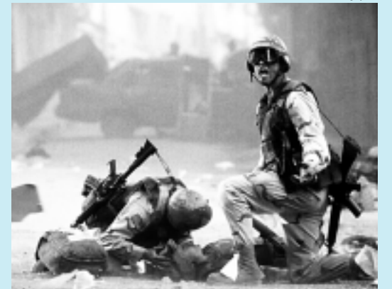
Cena de Falcão Negro em Perigo , de Ridley Scott

>>> FALCÃO NEGRO EM PERIGO - Outubro de 1993. Os Estados Unidos enviam um grande contingente de soldados para a Somália, que está passando por uma guerra civil, com o objetivo de desestabilizar o governo somali e poder levar ajuda a população faminta. Mas a operação, que deveria ser rápida, se complica quando dois helicópteros Black Hawk são abatidos por atiradores do exército local. Começa, então, uma batalha que dura 15 horas e deixa várias mortes. SE LIGUE: Hoje, às 22h, no A&E