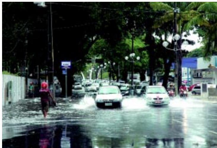
Pontos de ônibus, casas e avenidas ficaram cheias d'água. Nas estradas, seis acidentes foram registrados e, na cidade, carros ficaram parcialmente submersos