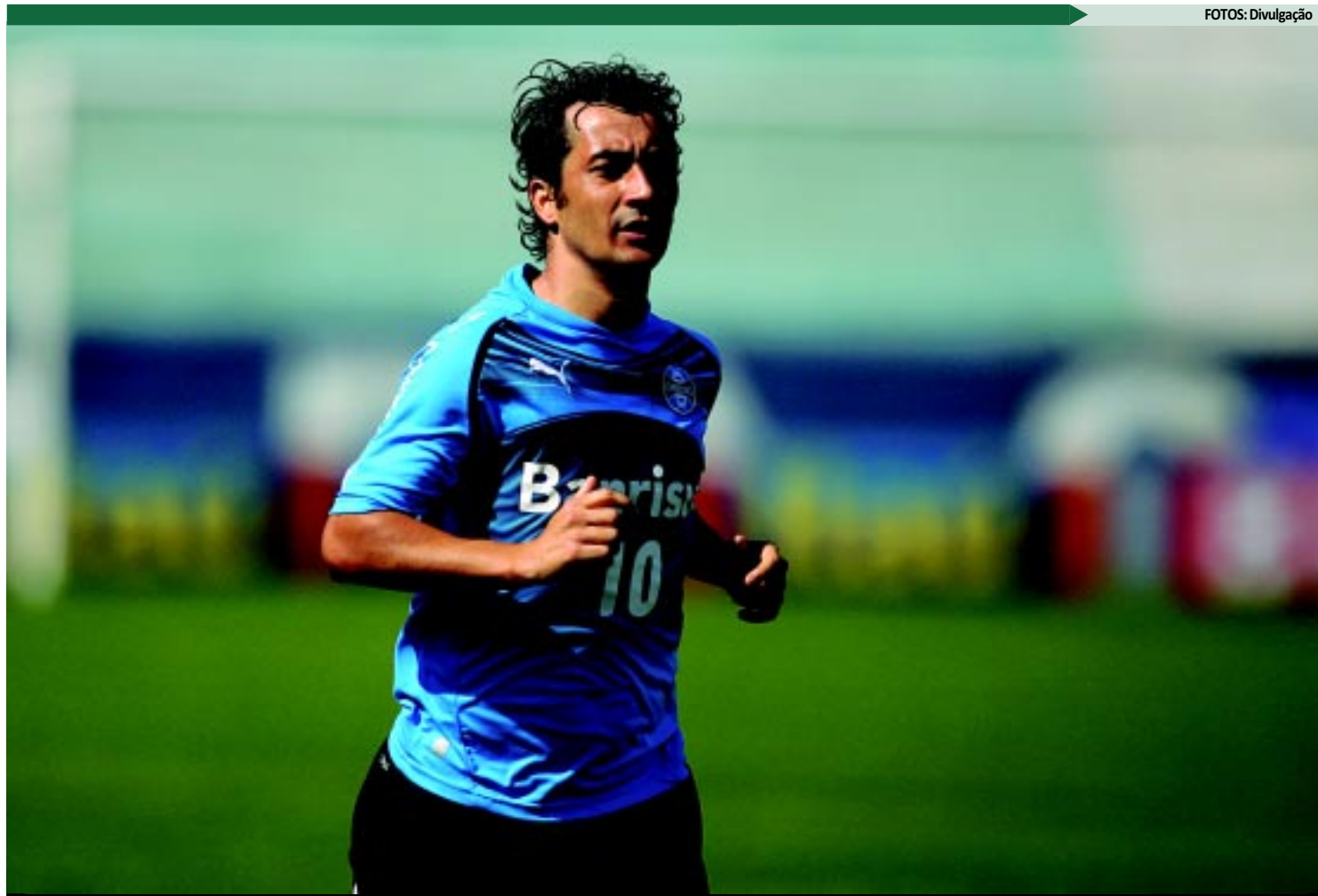
Douglas, que no momento não se entende com a diretoria do Grêmio, pode ir para o Flamengo para ocupar a vaga deixada por Thiago Neves

MARCOS GONZÁLEZ -Ver primeiro e falar depois. O chileno Marcos González adotou este lema antes da chegada ao Flamengo. Contratado por cerca de R$ 2 milhões do Universidad de Chile, o zagueiro, de 31 anos, chegou ao Rio de Janeiro ontem para fazer uma bateria de exames, antes de ser apresen-