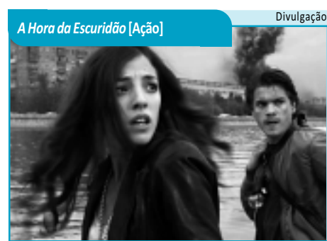
A Hora da Escuridão [Ação]

GATO DE BOTAS (Puss in Boots, EUA, 2011). Gênero: Animação. Duração: 90 min. Classificação: Livre. Dublado. Direção: Chris Miller. Antes de conhecer Shrek, Fiona, Burro e companhia, o Gato de Botas vivia suas próprias aventuras. Ao lado de Humpty Dumpty e de uma gata de rua, irá tentar roubar a famosa gansa que botava ovos de ouro. Tambiá 1: 14h10, 16h10, 18h10 e 20h10.