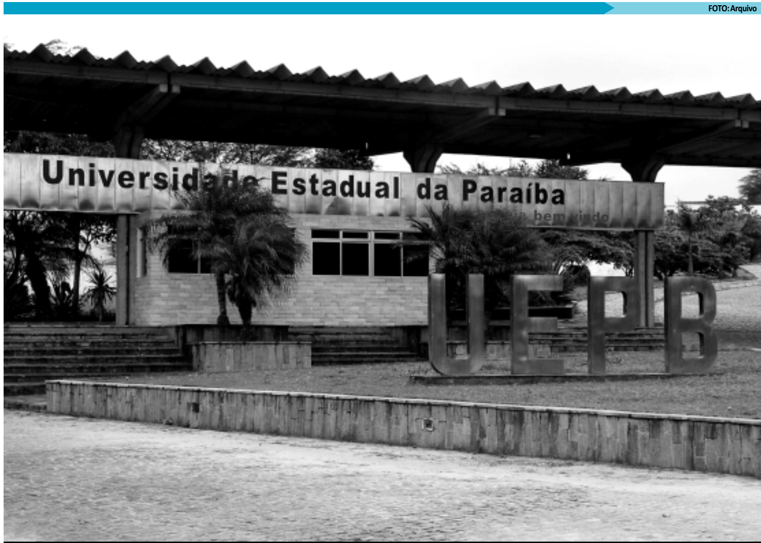
UEPB realiza concurso que oferece 279 vagas que serão disputadas por 35.827 candidatos inscritos; provas serão realizadas em duas fases

Segundo levantamento da Fundação Parque Tecnológico da Paraíba (PaqTcPB), responsável pelo concurso, o segundo cargo mais concorrido é o de Assistente Admi-