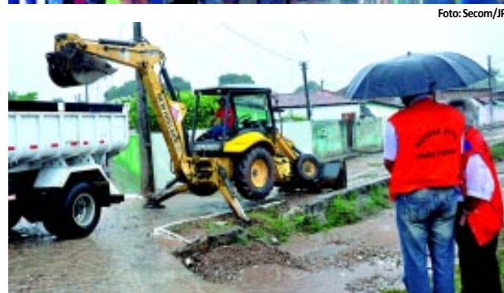
As chuvas deixaram várias ruas alagadas na Grande João Pessoa e muitas pessoas tiveram que enfrentar dificuldades para sair de casa. A Defesa Civil teve que entrar em ação para evitar problemas mais sérios em algumas comunidades