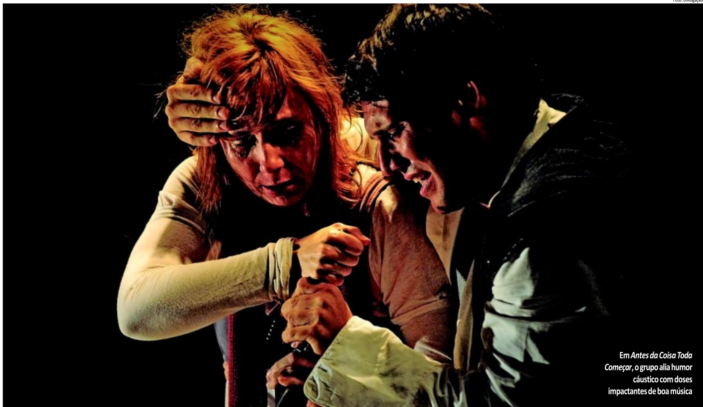
Em Antes da Coisa Toda Começar , o grupo alia humor cáustico com doses impactantes de boa música