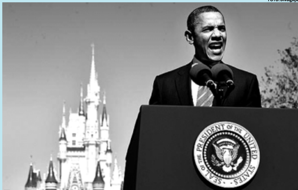
Na Walt Disney World, o presidente Barack Obama anuncia facilidades na emissão de vistos