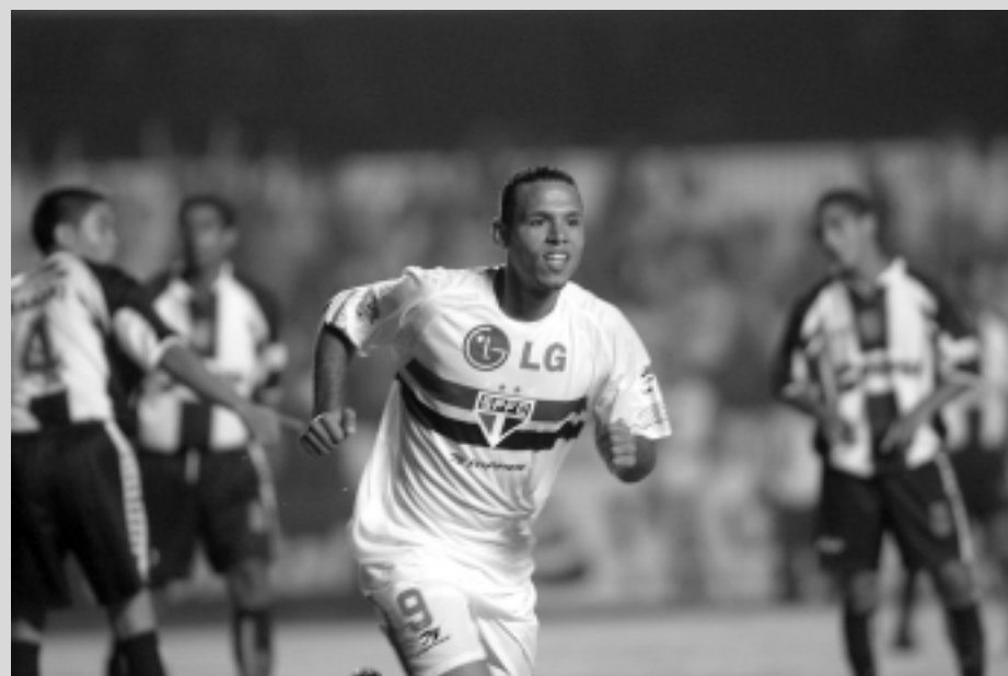
Atacante não deverá ser problema para a estreia da equipe no Campeonato Paulista, domingo

Com o goleiro Rogério Ceni e o volante Fabrício já vetados para a partida de domingo, o São Paulo deve entrar em campo com: Denis; Piris, Edson Silva (Paulo Miranda), Rhodolfo e Cortês; Wellington, Denilson, Cícero e Lucas; Fernandinho e Luis Fabiano.