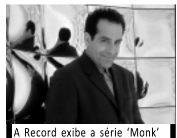
A Record exibe a série 'Monk'