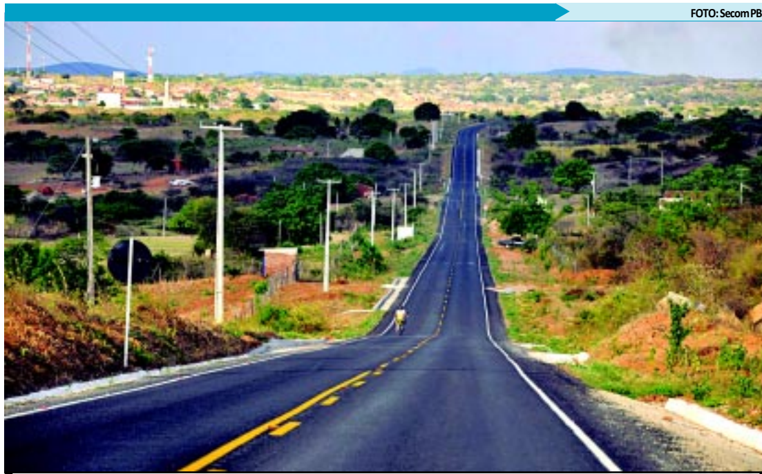
Rodovia recebeu R$ 6,3 milhões em recursos e etapa inaugurada deve beneficiar 71 mil habitantes da região

A unidade terá dois consultórios médicos, uma área de observação com dois leitos para pediatria, quatro leitos para clínica médica e dois leitos de atendimento de emergência na denominada sala vermelha, onde ficarão instalados equipamentos que possibilitarão um atendimento de qualidade aos pacientes mais graves.