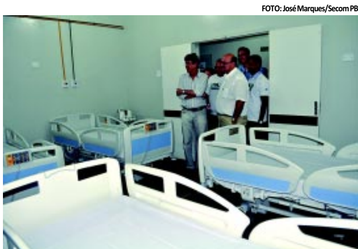
UPA de Princesa Isabel será semelhante a de Guarabira, inaugurada em 2011