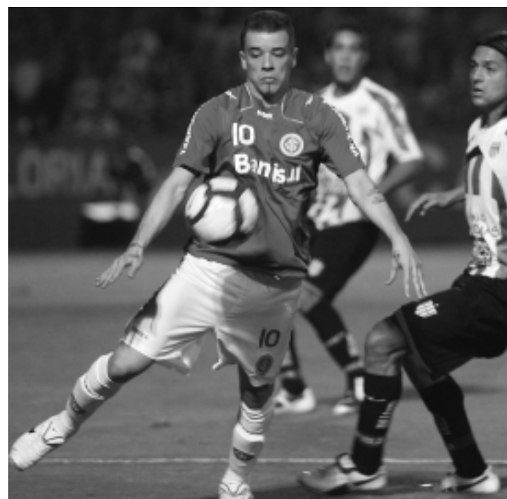
Meia argentino recebeu proposta da equipe chinesa Shanghai Shenhua

"O nosso time tem se preparado muito durante a pré-temporada para fazer uma boa estreia diante da nossa torcida e conseguir esta vitória no primeiro jogo", completou.