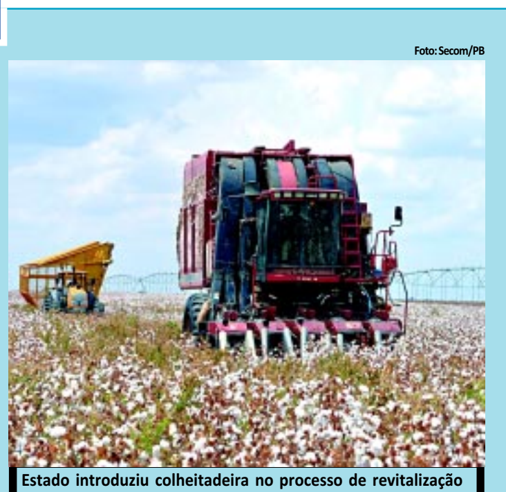
Estado introduziu colheitadeira no processo de revitalização

A Paraíba iniciou nova fase no cultivo de algodão herbáceo, com o início da colheita nas Várzeas de Sousa. Foi a primeira vez que se utilizou uma máquina colheitadeira, como parte do processo de revitalização da cultura. Toda semente será exportada para outros estados. PÁGINA 21