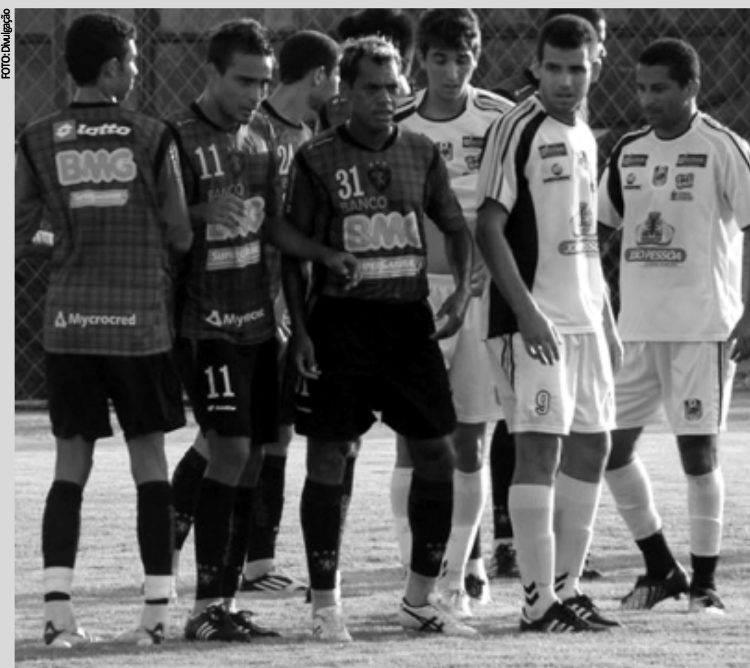
Amistoso entre CSP e Sport foi cancelado e clube pessoense volta a jogar terça-feira contra o ABC