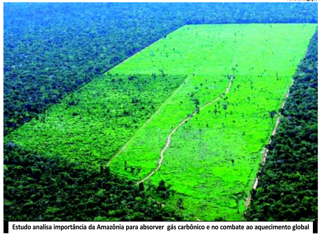
Estudo analisa importância da Amazônia para absorver gás carbônico e no combate ao aquecimento global

Diante do impasse, governos pediram que mais tempo fosse dado para permitir que o assunto fosse melhor estudado. Por enquanto, portanto, o horário mundial continuará estando ligado com a rotação da Terra. No próximo dia 30 de junho, um segundo extra será adicionado mais uma vez para sincronizar os relógios à Terra.