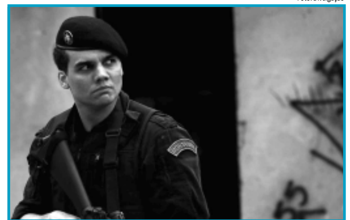
TROPA DE ELITE 2 PERDE DISPUTA AO OSCAR

#A Academia de Artes e Ciências Cinematográficas de Hollywood, que concede o Oscar, divulgou a pré-seleção de nove filmes em língua não inglesa que poderão disputar o prêmio de Melhor Filme Estrangeiro, excluindo da lista o brasileiro "Tropa de Elite 2", de José Padilha. A lista que contém filmes do Irã, Bélgica, Alemanha, Canadá, Dinamarca, Israel, Marrocos, Polônia e Taiwan, será reduzida a cinco na próxima terça-feira, quando forem anunciados os indicados aos prêmios.